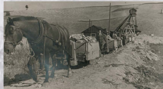
Wywożenie urobku z kopalni.

Jak głosi encyklopedia – minerału, Będącego drobnoziarnistą odmianą gipsu. Znany był już w starożytności, uznawany Za wyśmienity surowiec rzeźbiarski. Wykonywano z niego przedmioty dekoracyjne, A także użytkowe. Traktowano jak kamień Okładzinowy, wykorzystywano do produkcji Sypkiego gipsu. Dziś jednak, mimo iż jego Złoża są wciąż spore i uważany jest Za materiał bardzo dobrej jakości, Nikt go tu, z różnych przyczyn, już nie wydobywa.