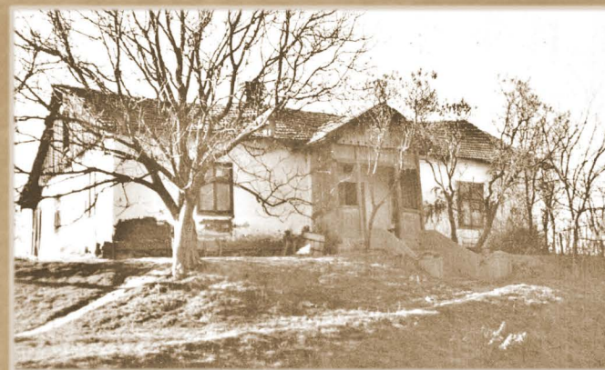
Nieistniejący już dom rodziny Hałdysów.

Rodzina żydowska najpierw w ukryciu u rodziny Hałdysów zamieszkała, Potem ukrywali się na polach i tam ich historia dla nas się urwała.