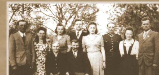
Rodzina Chmurów.